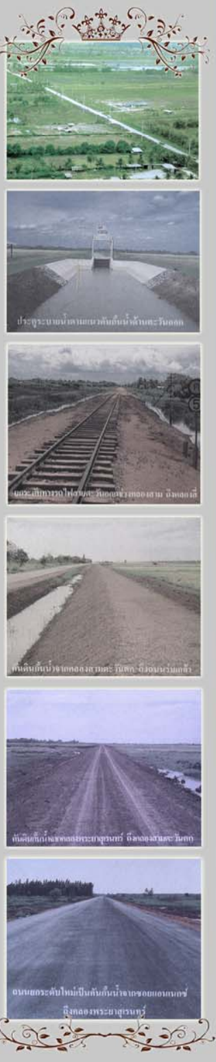
ถนนยกระดับใหม่ป้องกันน้ำท่วมของแอมเทคซ์ ถึงคลองพระยาสุเรนทร์

Department of Drainage and Sewerage, Bangkok Metropolitan Administration 123 Mitmaetri Road, Dindaeng District, Bangkok 10400, Thailand Tel 0 2248 5115 Fax 0 2246 0320